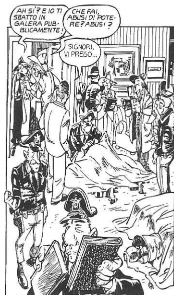
La tipica "scena del delitto".